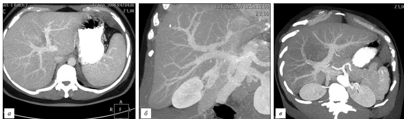
Рис. 2. Мультипланарная реконструкция вариантов ветвления воротной вены.

а – типичное; б – формирование общего ствола ветвей правого парамедианного сектора и левой доли; в – трифуркация.